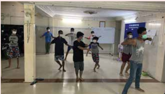
○ 留守在彩虹橋的孩子在導師指導下每天做體操，保持身體健康。此外，孩子們一同祈禱，希望主耶穌保守在隔離中心的朋友們。