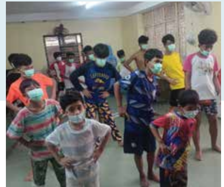
○ 每天大家一同做體操。

在這漫長的隔離期，大家更學懂了在陌生的地方互助互愛、一同打點及處理家務，對孩子來說也是一個寶貴的歷程。經過兩個月的寧靜，彩虹橋宿舍再次變得熱鬧起來，我們為孩子準備好燒雞大餐來慶祝，孩子們辛苦了，歡迎回到彩虹橋大家庭！