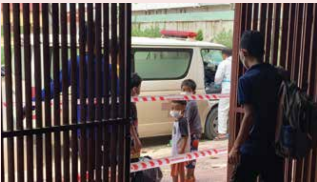
○ 年紀小的孩子要離開熟悉的家，感到十分惶恐。

2021年6月，我們收到33個彩虹橋孩子（25個於兒童院舍、7個女生宿舍和1個彩虹橋孤兒大學生）感染了新冠肺炎的消息，猶如晴天霹靂。全部確診的孩子都被送到鑽石島隔離中心，不得有成人陪伴，我們實在很擔心。