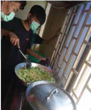
○ 大小孩子合作處理一切起居飲食是一個新挑戰呢！

在生命樹宿舍的隔離期對孩子是全新的挑戰，在完全沒有院長、看護姨姨和導師指導下，大小孩子要合作處理一切起居飲食，包括煮飯、日常清潔、家務、探熱和記錄體溫等等。除了住得稍為擠迫之外，倒也樂也融融。由於孩子們的測試結果很反覆，彩虹橋由原來封鎖的14天，到不斷再有孩子復陽而延遲解封。經過六星期的隔離後，孩子終於能夠回到熟悉的家了！