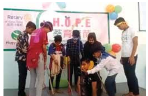
◎ 孩子們一起演出「瞎子摸象」的故事。

除了英語講故事比賽外，每個級別的孩子還準備了英語戲劇表演，他們的造型和表現在讓我們捧腹大笑和喜出望外！孩子們的創意和組織力是不容忽視的，只要給予機會和鼓勵，他們便能從生活中發揮，從經驗中成長！