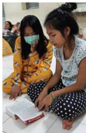
○ 孩子在隔離中心裡不忘一同閱讀聖經，因他們知道無論身在何地，主耶穌都與他們同在。

慶幸彩虹橋大孩子在隔離中心的時候自覺照顧較少的孩子，而孩子們亦在電話說隔離中心環境不錯，飯餸亦尚算可口，才讓我們放下心頭大石。孩子們除了帶了衣物到隔離中心外，還有孩子帶了聖經。他們的舉動實在令我們感動，因為孩子知道在任何逆境，主耶穌都與他們同在。我們每天都記掛着這群孩子，希望他們能夠平安健康。