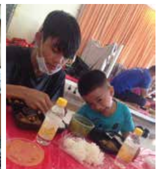
○ 幸好有彩虹橋的大哥哥在旁，較少的孩子在隔離中心也不害怕了。