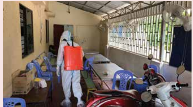
○ 受感染的孩子被送往隔離營後，衛生局派人到院舍消毒，防止留守的孩子受到感染。